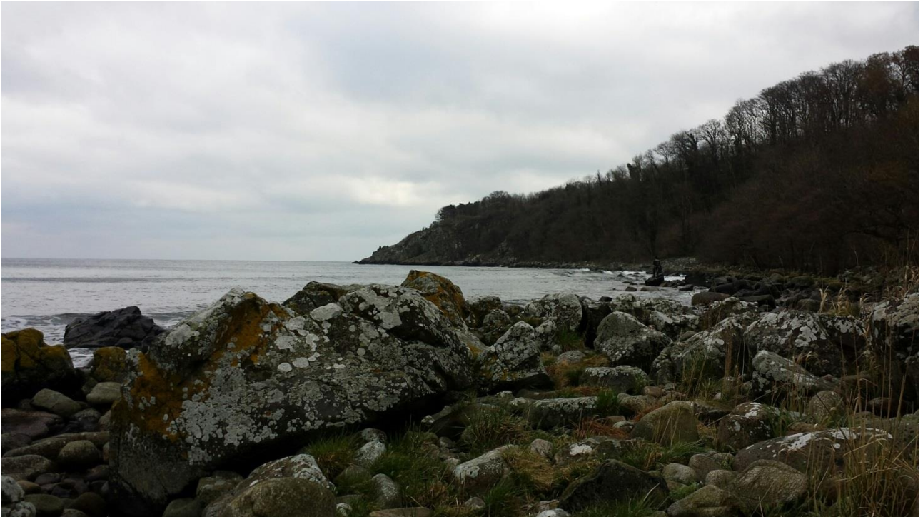
Foto fra Salne med kig ud mod Hestestenen.

Under overfladen var der stadig en del tang, der satte sig på line og agn, så efter et par timer valgte vi at skifte plads.