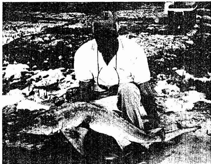
Gråhaj 149½ cm., knap 50 kg