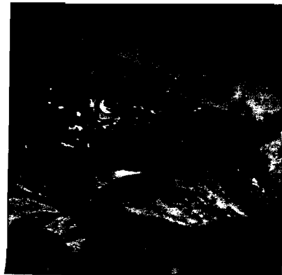
Den æder alt