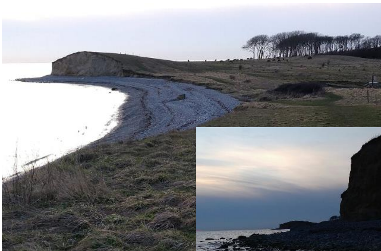
Dovns klint og Gulstav