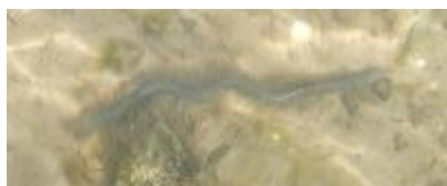
Mums for havørred.