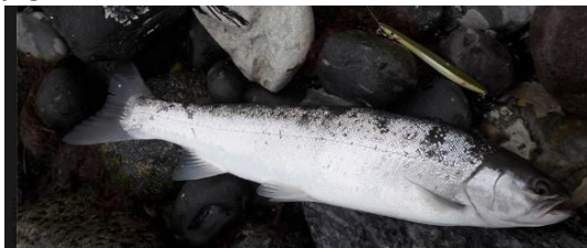
Jacobs fisk, Genudsat.

Det er massage af krybdyrhjernens jagtinstinkter