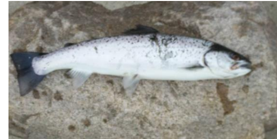
Søren Møllenbergs fisk

Gang i den var der i mørkningen for Paw der havde en længere dans men en blank 3 kg plusser, der få meter inden landingen valgte at springe linen. Den junior har noget med mord i mørket.